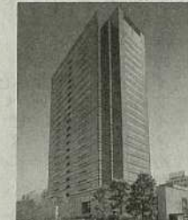
⑩ 武蔵小杉駅前事務所